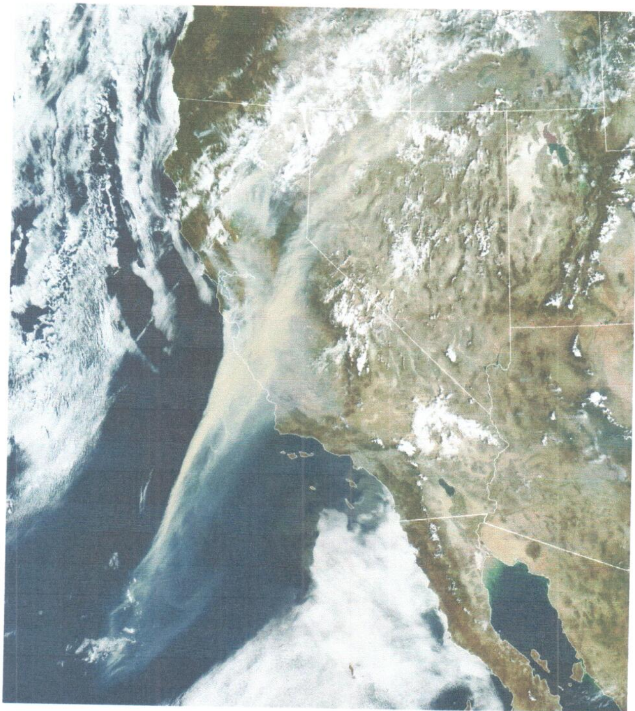
Рисунок к Задаче 1